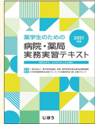
薬学生のための 病院・薬局実務実習テキスト2021年版

日本薬剤師会ホームページにも実務実習に関する資料・情報が掲載されています ( https://www.nichiyaku.or.jp/ → 日本薬剤師会の活動 □ 薬学教育・実務実習)