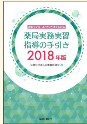
薬局実務実習指導の手引き2018年版